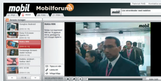
Mediaproviders nyutvecklade webb-tv spelare