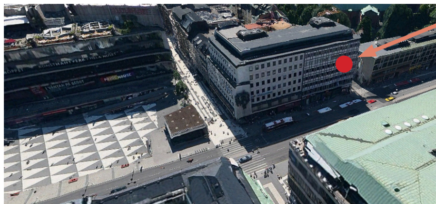
Bolagets nya lokaler på Klarabergsgatan i Stockholm